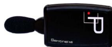
Sonomètre déporté bande d'octave